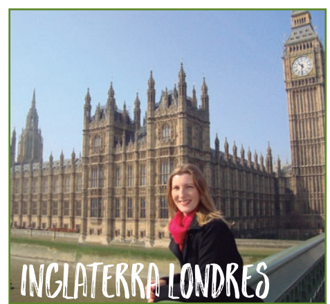
INGLATERRA LONDRES

Saldremos hacia KINDERDIJK , sus 19 molinos del siglo XVIII han sido declarados patrimonio de la Humanidad por la UNESCO. Seguimos hacia Bélgica. BRUSELAS , breve visita de la zona del Atomium, tiempo posterior para pasear y almorzar en la zona de la Gran Plaza. A media tarde continuación hacia Francia. PARIS . Llegada al final del día. Fin de nuestros servicios.